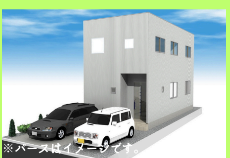
※パースはイメージです。

■土地面積:107.33㎡(32.46坪) ■建物面積: 89.61㎡(27.10坪)