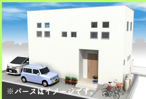
※パースはイメージです。

■土地面積:101.97㎡(30.84坪) ■建物面積: 81.14㎡(24.54坪)