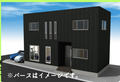
※パースはイメージです。

■土地面積:109.26㎡(33.05坪) ■建物面積: 89.42㎡(27.04坪)